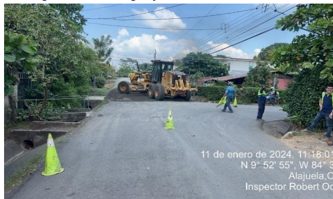
Personal de Inspección Municipal y Cuadrilla Vial sin uniformes adecuados