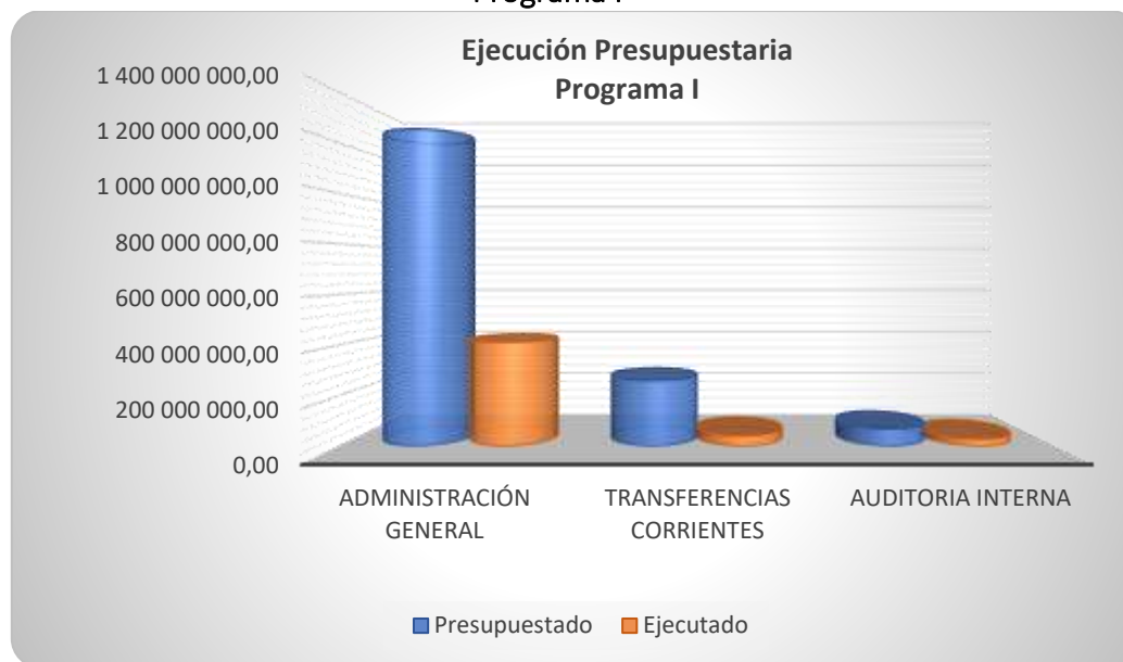
Gráfico 2. Ejecución presupuestaria 2019 Programa I