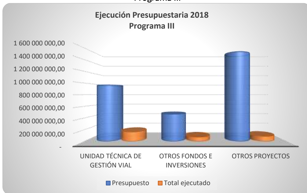
Gráfico 4. Ejecución presupuestaria I Semestre 2019 Programa III

Fuente: Informe de Ejecución Presupuestaria 2019