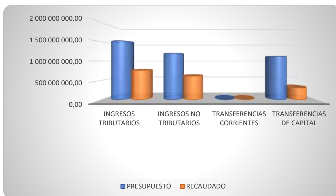
Gráfico 1. Ejecución Presupuestaria Ingresos 2019